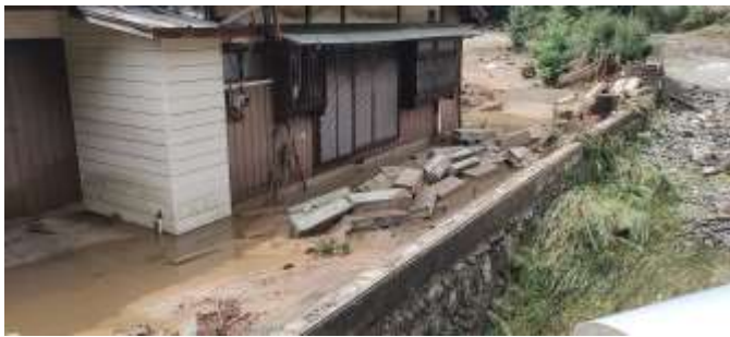
⑥ 梅見橋脇の民家 9/9 P m