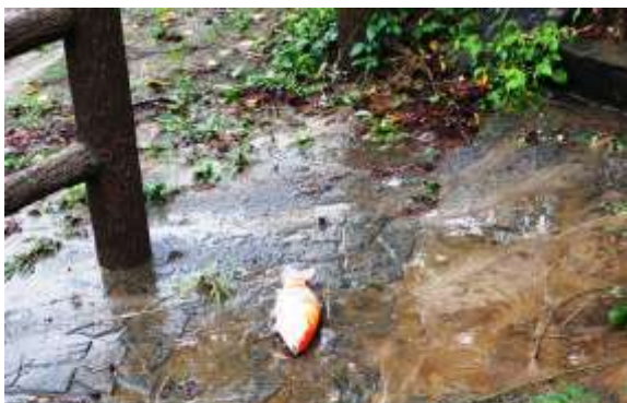
⑧ 鮎川ふれあい橋歩道に流された錦鯉 9/9 A m