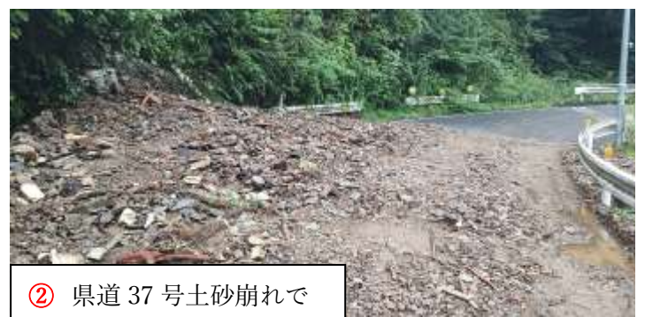
② 県道37号土砂崩れで 通行止め 9/9 P m