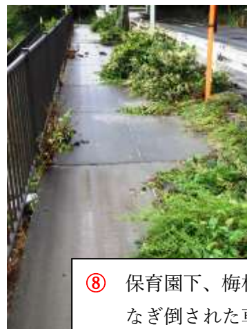
⑧ 保育園下、梅林通り歩道の なぎ倒された草木 9/9 A m