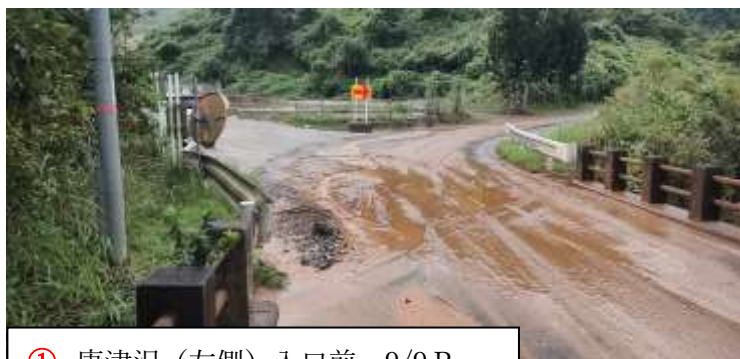
① 唐津沢（左側）入口前 9/9 P m