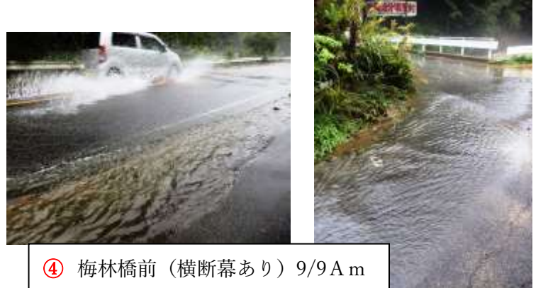
④ 梅林橋前（横断幕あり）9/9 A m