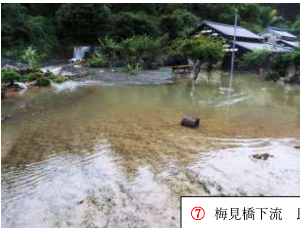
⑦ 梅見橋下流 民家の広い庭と玄関 9/9 A m