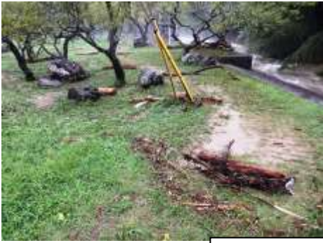
⑤ 梅林内 流木 9/9 A m