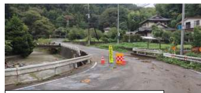
③ 大平田橋（鮎川・北の沢合流部） 「工事中通りぬけできません」9/9 P m