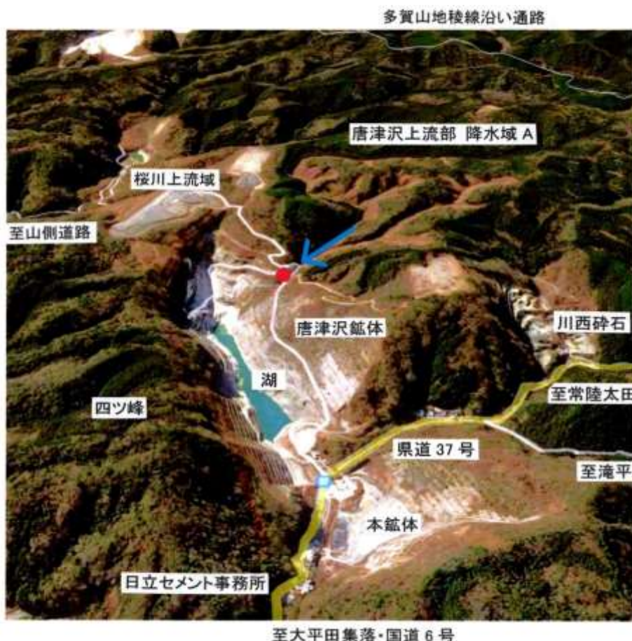
左図：唐津沢産廃処分場予定地

県や市は、直ちに計画を見直すべきであり、是正措置が不可能であれば、建設計画を早期に取り止めるべきである。