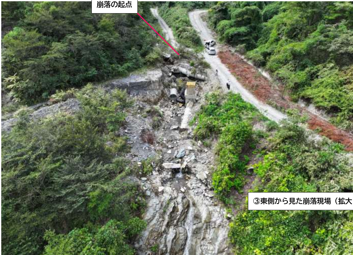
③東側から見た崩落現場（拡大1）