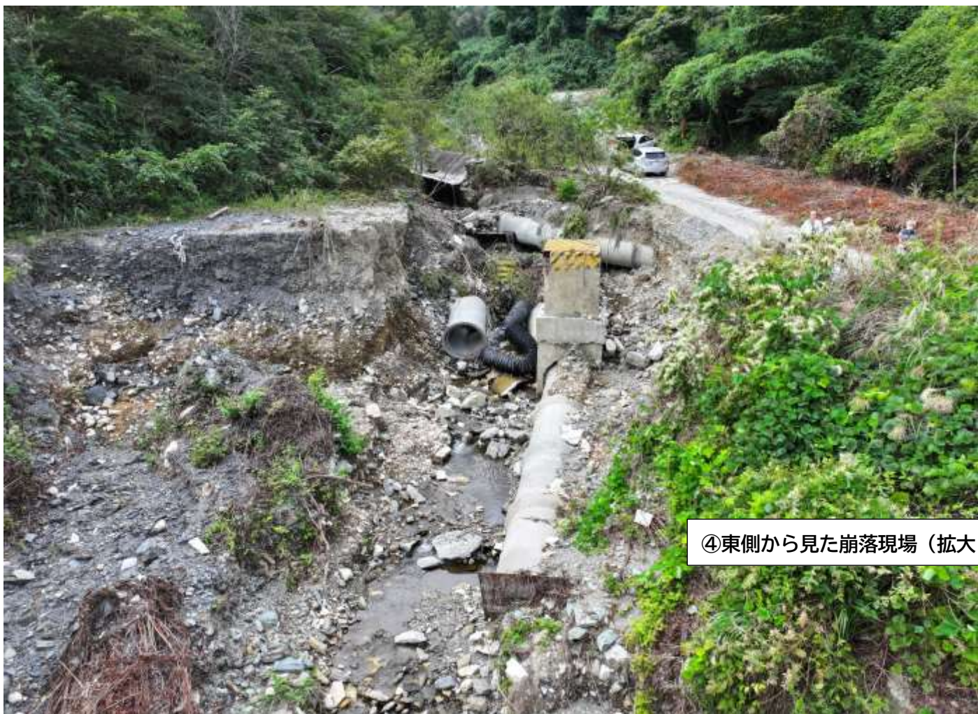
④東側から見た崩落現場（拡大2）